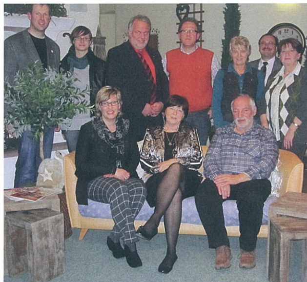
Vorstand der „Alzheimer Gesellschaft Nördliches Rheinland Pfalz e.V.“